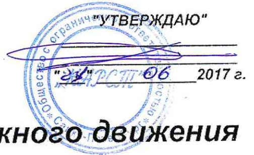
Схема организации дорожного движения на время производства работ

инженер ПТО Малерьянов Р.В. "24" 06 2017г.